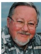
Konkurso-festivalio Garbės narys Profesorius dr. Vytautas LANDSBERGIS Corresponding member of the competition-festival, Professor dr. Vytautas LANDSBERGIS