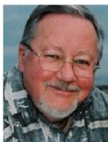
Konkurso-festivalio Garbės narys Profesorius, hab. dr. Vytautas LANDSBERGIS Corresponding member of the competition-festival, Professor, Dr hab. Vytautas LANDSBERGIS